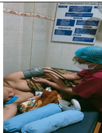
Partus Kala 4