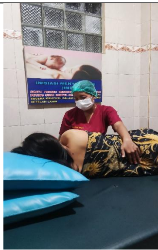
Memberikan Pijatan pada partus kala 1