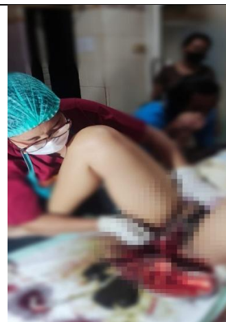
Partus Kala 3