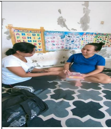
Mengajarkan Teknik pernafasan (relaksasi)