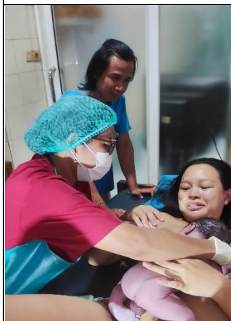
Inisiasi Menyusu Dini