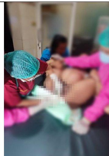
Partus Kala 2