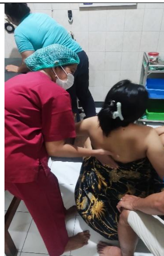
Penggunaan gym ball untuk mengurangi nyeri