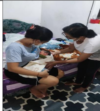
Kunjungan Rumah KN 2 dan KF 2