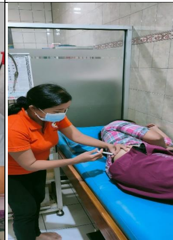
KF 4 Kontrasepsi suntik 3 bulan