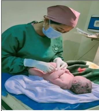
Pemeriksaan Fisik BBL 1 Jam pertama