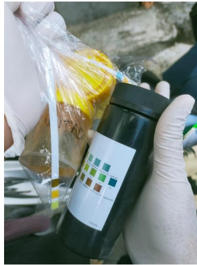
Gambar 8. Spesimen Urine dan Stik Urine