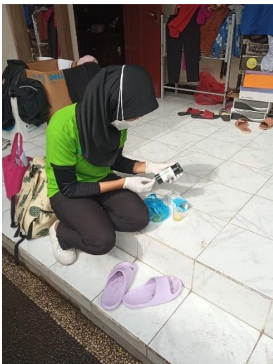
Gambar 5. Pemeriksaan Protein Urine Menggunakan Dipstick