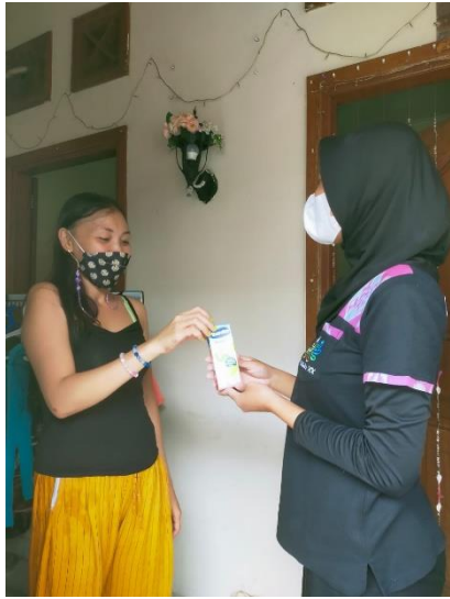
Gambar 7. Pemberian Kompensasi Pasa Responden