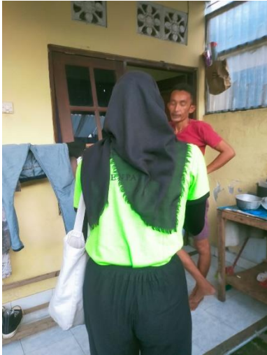
Gambar 3. Kunjungan ke Rumah Pasien Tuberkulosis Paru