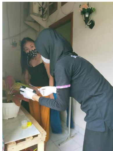
Gambar 6. Penjelasan Hasil Pemeriksaan Protein Urine Kepada Pasien