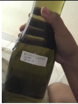
Filtrat yang didapatkan dari hasil maserasi