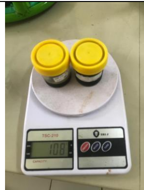
Berat ekstrak kental