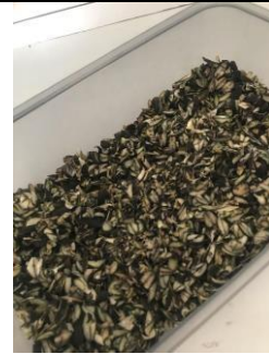
Biji buah salju yang sudah dikeringkan dengan oven