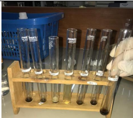
Hasil uji skrining fitokimia