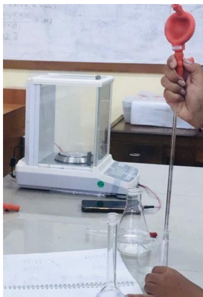
Pembuatan larutan stok