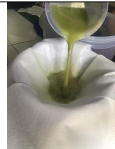
Proses penyaringan sampel