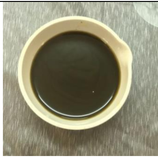
Dari proses evaporasi didapatkan ekstrak kental