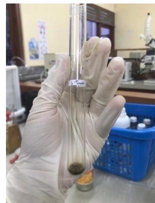
Senyawa tanin yang positif