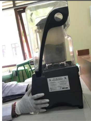
Sampel dihaluskan dengan diblender