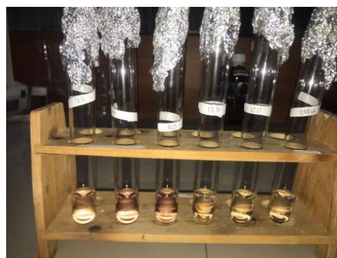
Konsentrasi setelah di inkubasi 30 menit