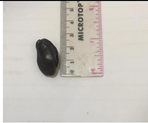
Kriteria biji buah salju yang digunakan ukuran 2,3 cm