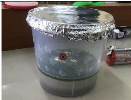
Sampel ditutup rapat