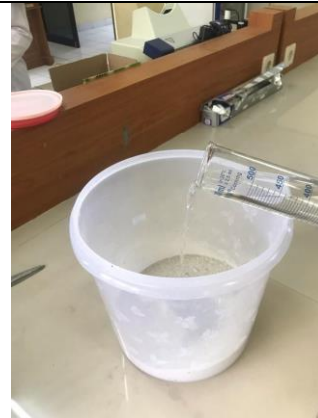
Sampel ditambahkan etanol 96%