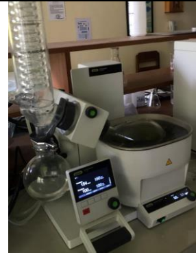
Dilakukannya proses evaporasi