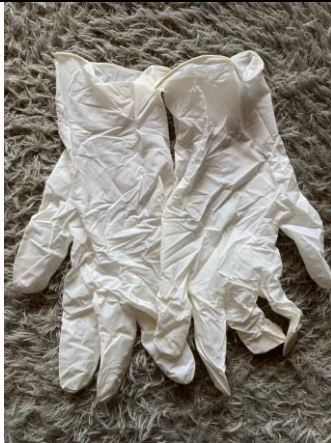
Alat Pelindung Diri