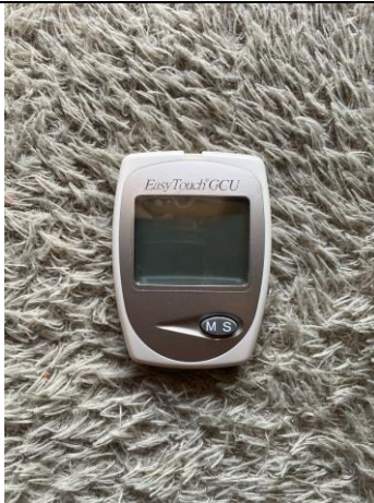
POCT Esay Touch