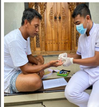
Dokumentasi Penelitian Kadar Kolesterol