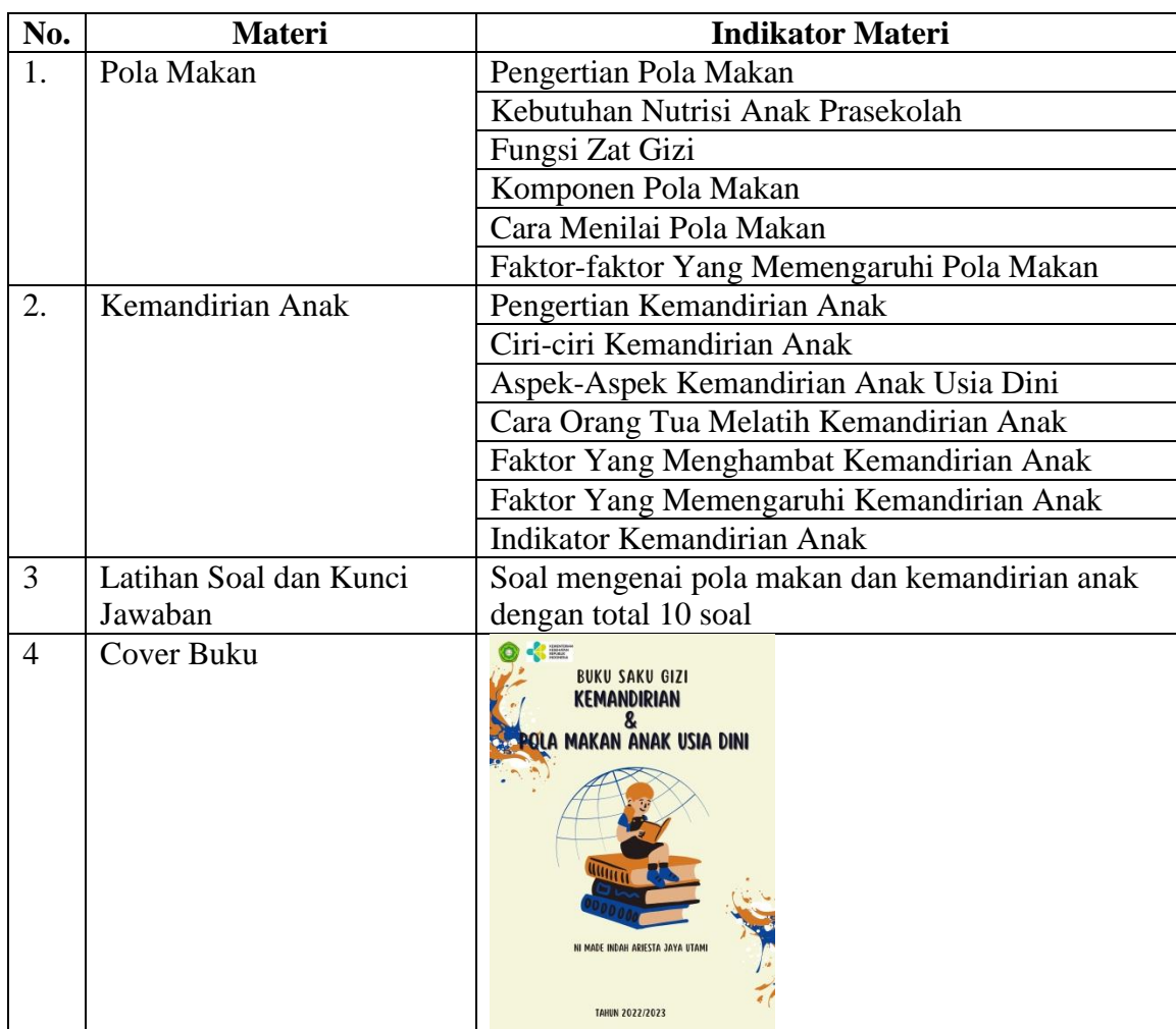
Tabel 15. Kisi-kisi Buku Saku Gizi