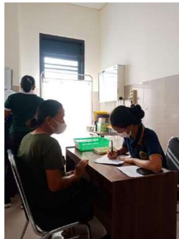
Gambar 9 Dokumentasi Kegiatan Pengumpulan Data