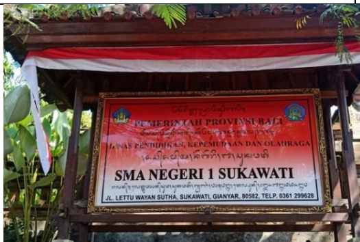
Ket: Profil SMAN 1 Sukawati