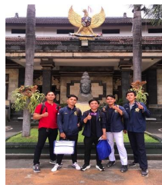
Ket : Foto bersama enumerator