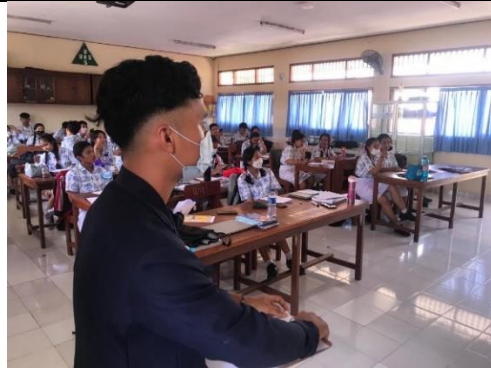
Ket : Menyebarkan form PSP