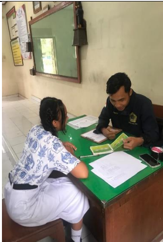
Ket : Melakukan wawancara recall