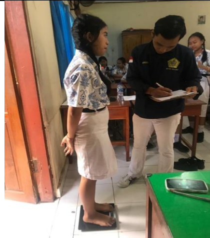
Ket : Menimbang berat badan