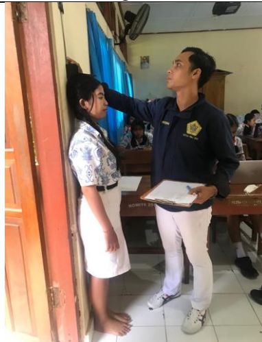
Ket : Mengukur tinggi badan