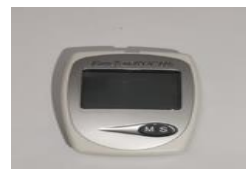
Alat POCT Hb