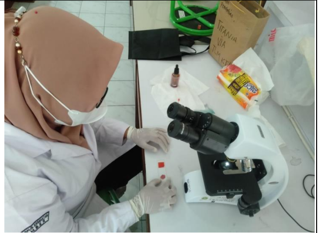
Pembuatan Preparat dengan Eosin 2%