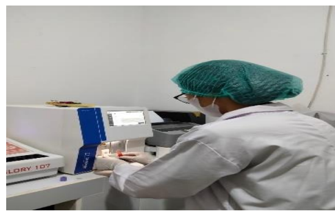
Gambar 6 (Pemeriksaan Sampel Menggunakan Alat Medonic M-Series Hematology Analyzer di Lab Klinik Anugrah Bangli)