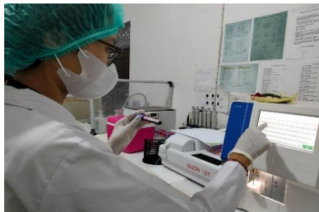
Gambar 5 (Proses Input ID Sampel Pada Alat Medonic M-Series Hematology Analyzer di Lab Klinik Anugrah Bangli)