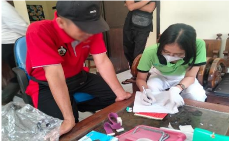
Gambar 1 (Wawancara dan Pengisian Informed Consent dengan Responden)