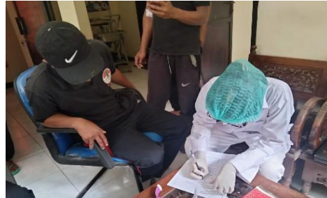
Gambar 2 (Wawancara dan Pengisian Informed Consent dengan Responden)