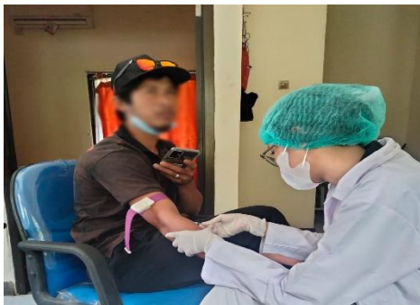
Gambar 3 (Pengambilan Sampel Darah Vena Pada Responden)