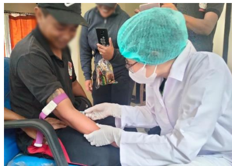
Gambar 4 (Pengambilan Sampel Darah Vena Pada Responden)