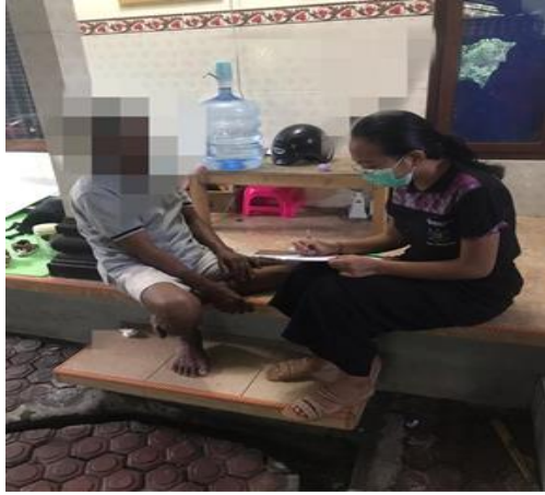
penandatanganan lembar persetujuan