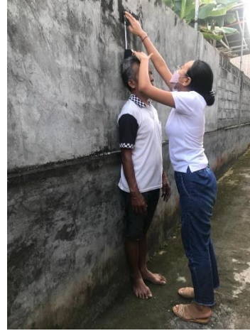
Proses pengukuran tinggi badan responden