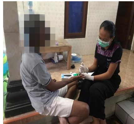
Proses pengukuran kadar asam urat darah