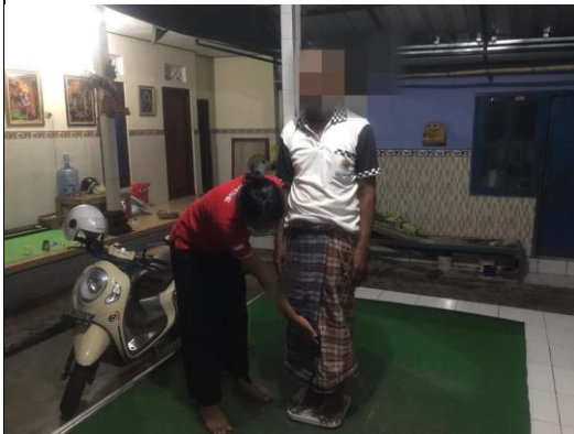
Proses pengukuran berat badan