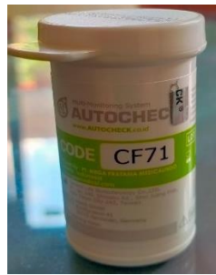
Strip test asam urat