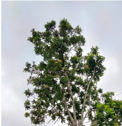
Gambar 1 Tanaman Alpukat