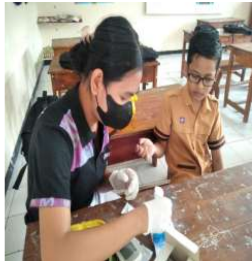
Memberi kapas alkohol