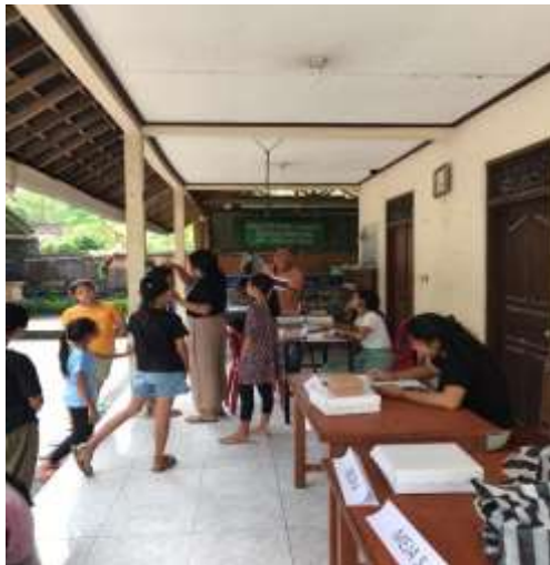
Pengukuran antropometri (tinggi badan)