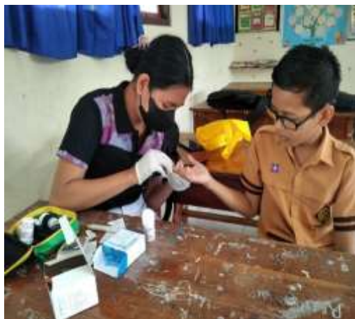
Melakukan penusukan pada darah kapiler