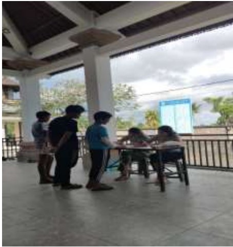
Pengisian Informed consent