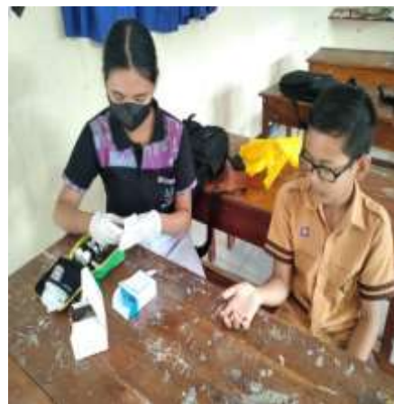
Penutupan dengan kapas kering