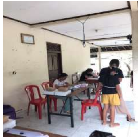
Pengukuran antropometri (lingkar badan)