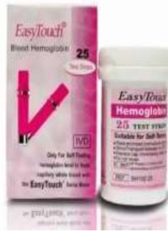
Strip Test Hb