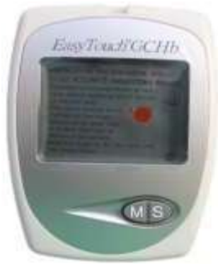
Alat Easy Touch GCHb