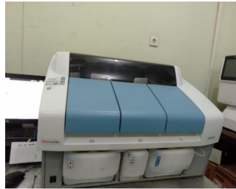
Gambar 6. Alat kimia Indiko Plus Analyzer