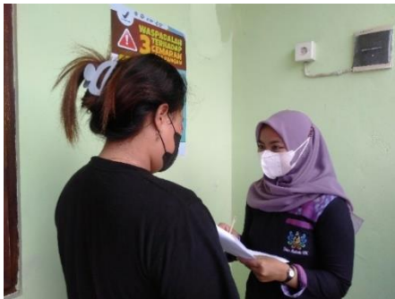
Gambar 7. Melakukan wawancara dengan responden