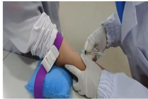
Gambar 8. Pengambilan darah vena responden