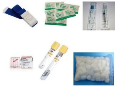
Gambar 5. Alat dan bahan yang digunakan untuk pengambilan sampel darah vena