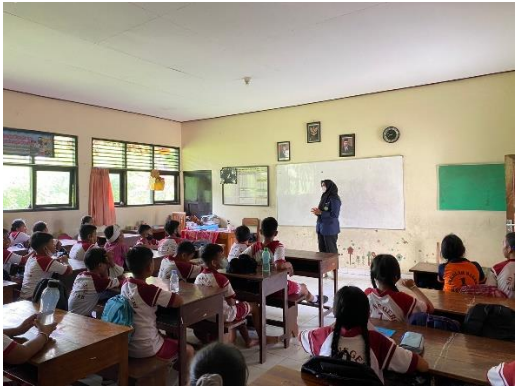
Perkenalan dan Penjelasan Tujuan