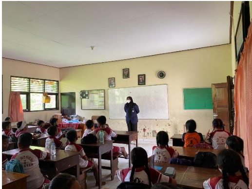
Perkenalan dan Penjelasan Tujuan