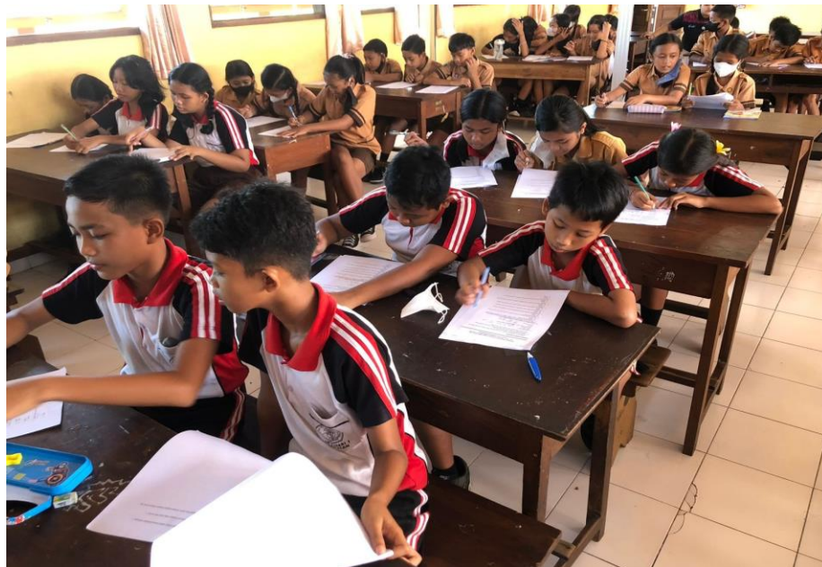
Dokumentasi 2 Pengisian kuesioner