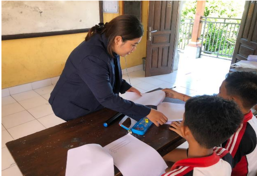
Dokumentasi 1 Pembagian kuesioner