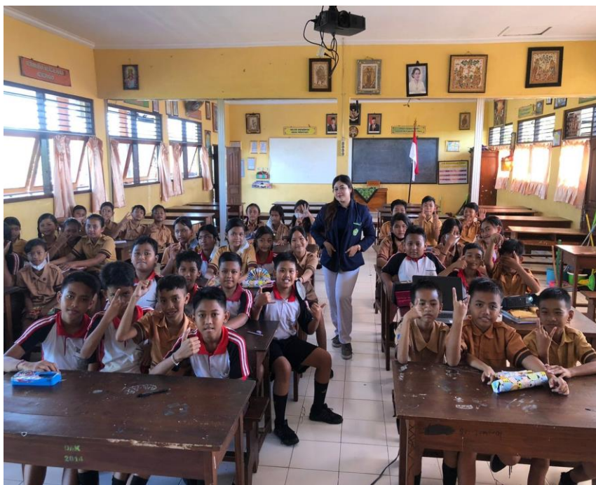
Dokumentasi 4 Foto bersama