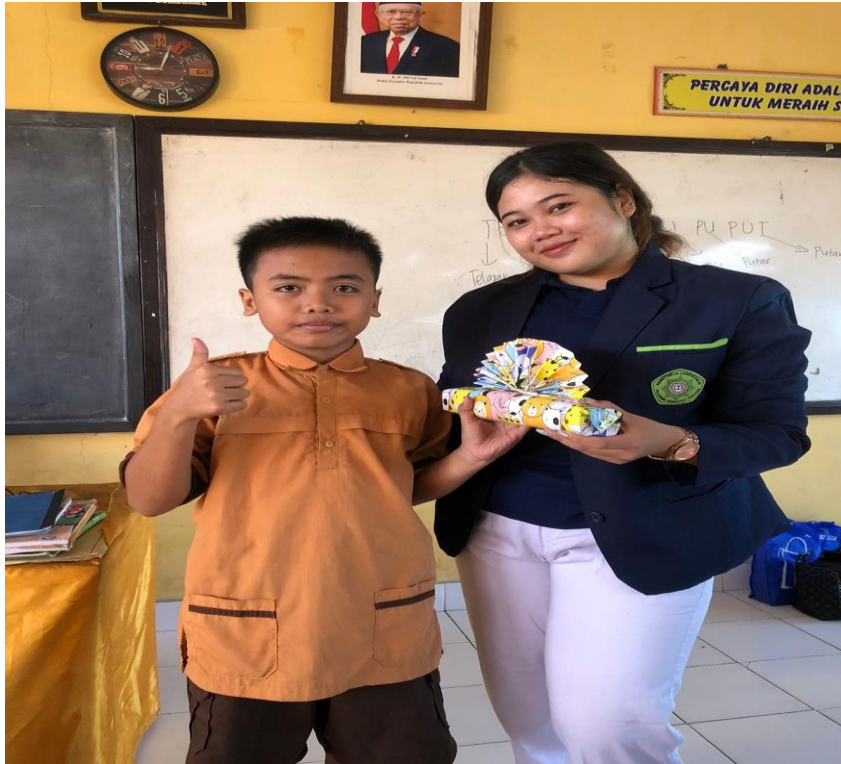
Dokumentasi 3 Pembagian hadiah