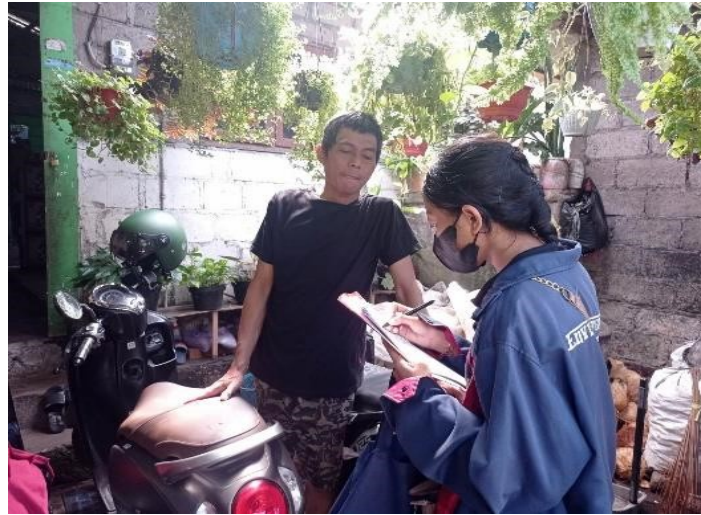
Wawancara dengan salah satu Kepala Keluarga di Kelurahan Kerobokan Kaja.