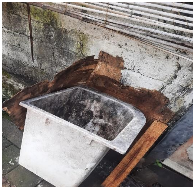
Keadaan sarana tempat sampah di salah satu rumah warga pada Lingkungan Kelurahan Kerobokan Kaja.