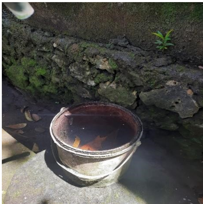
Keadaan air yang masih tergenang di salah satu rumah warga Lingkungan Kelurahan Kerobokan Kaja.