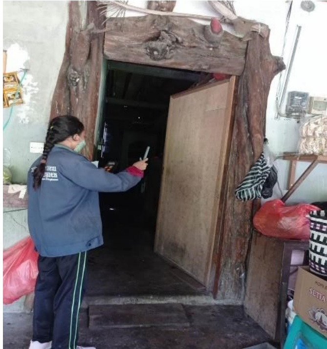
Melakukan pengukuran kelembaban dan suhu menggunakan alat Termohygrometer.