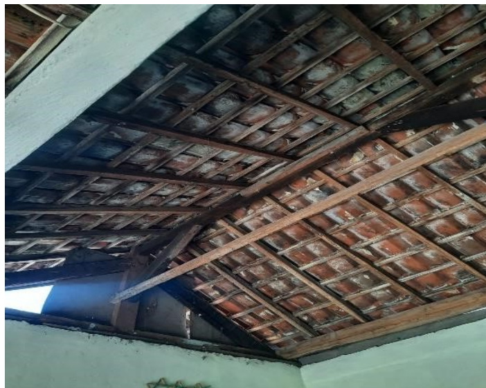
Keadaan Langit-langit disalah satu bangunan komponen rumah di Kelurahan Kerobokan Kaja.