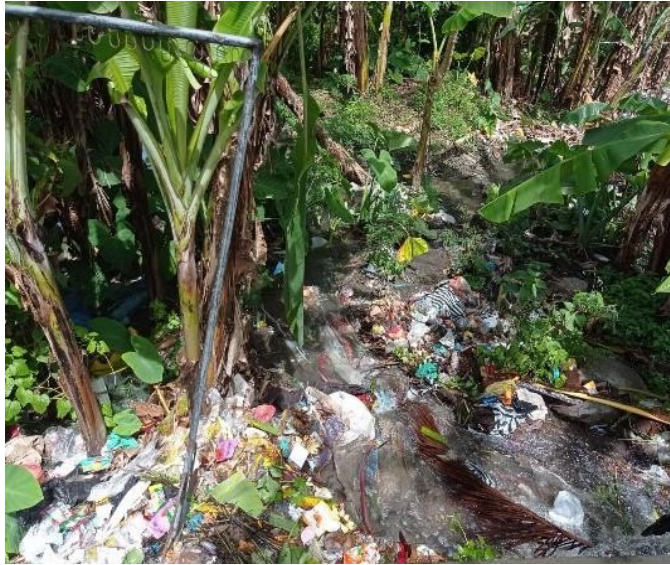
Keadaan pembuangan sampah yang dibuang ke sungai di salah satu Lingkungan Kelurahan Kerobokan Kaja.