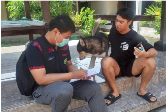
Dokumentasi Pengambilan Data dan Wawancara Terhadap Responden di Banjar Kaja