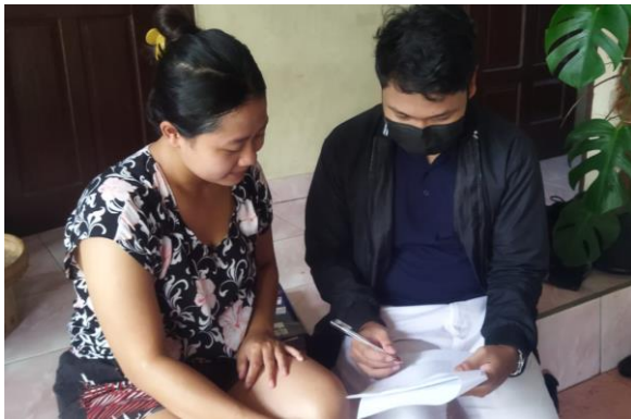
Dokumentasi Pengambilan Data dan Wawancara Terhadap Responden di Banjar Pegok