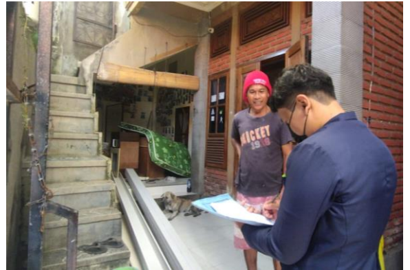
Dokumentasi Pengambilan Data dan Wawancara Terhadap Responden di Banjar Dukuh Sari