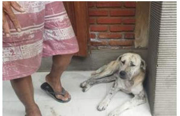
Dokumentasi Hewan Gigitan Penular Rabies