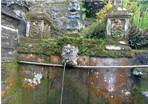
Gambar 1. Salah satu sumber mata di Desa Nyitdah