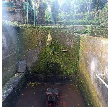
b. Pancoran Dalem