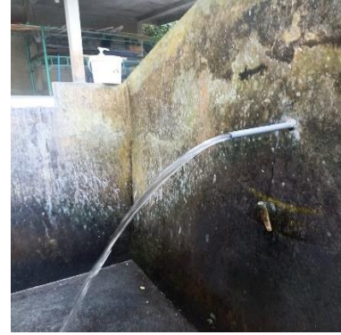
c. Pancoran Sengguan