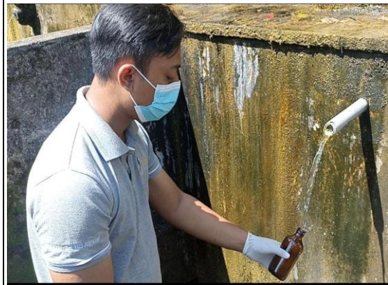
Gambar 2. Pengambilan sampel pada sumber mata air