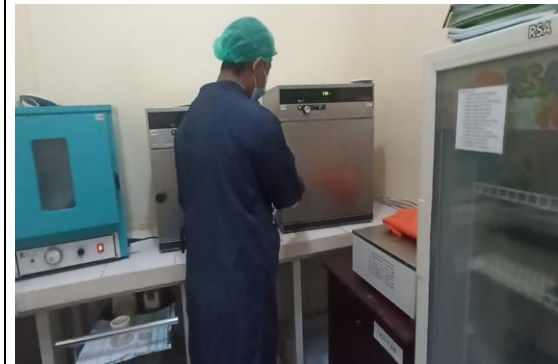
Gambar 4. Sampel sumber mata air di inkubasi dalam alat incubator pada suhu 35°C selama 24 – 48 jam.