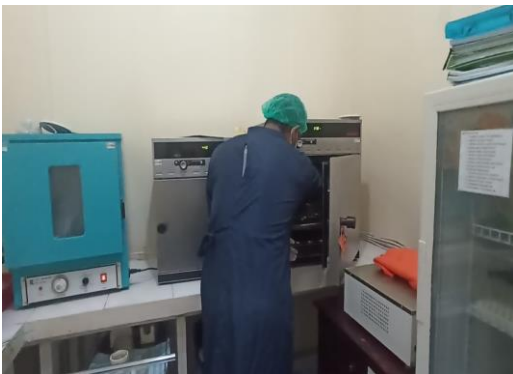
Gambar 7. Dilakukan inkubasi ulang.