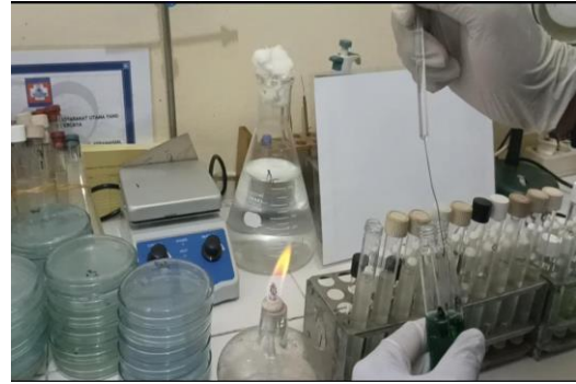
Gambar 6. Dilakukan uji penegasan dengan memindahkan 1-2 ose pada media BGLB.