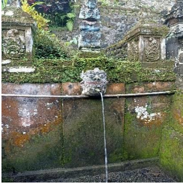
a. Pancoran Mengening