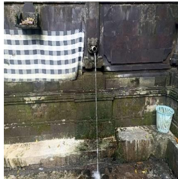
e. Pancoran Pemesan