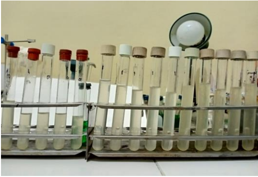
Gambar 5. Tabung diamati apakah terbentuk gas pada tabung burham.