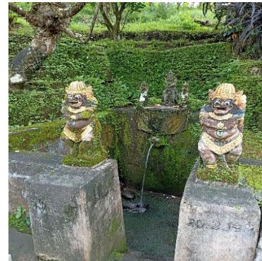
f. Pancoran Antugan