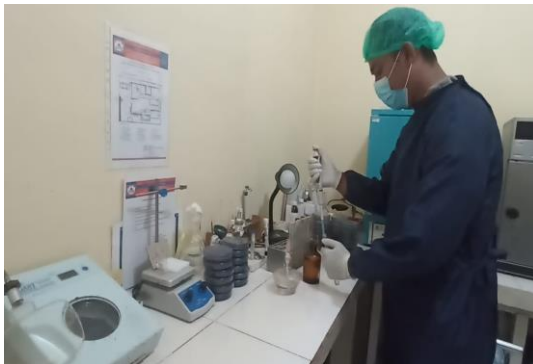
Gambar 3. Sampel dipipet ke dalam media LB (Lactose Broth)