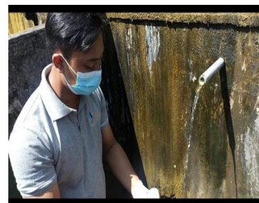
g. Pancoran Sudha