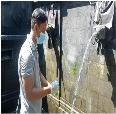
d. Pancoran Tegal