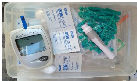
Gambar : Persiapan Alat