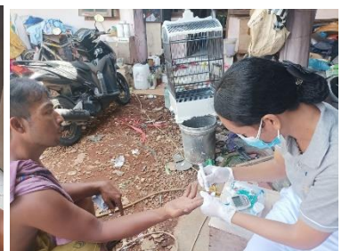
Gambar : Pengambilan Sampel Darah Kapiler