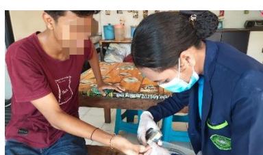
Gambar : Pemeriksaan Kadar Kolesterol Total