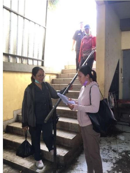
Wawancara dengan kepala pasar mambal