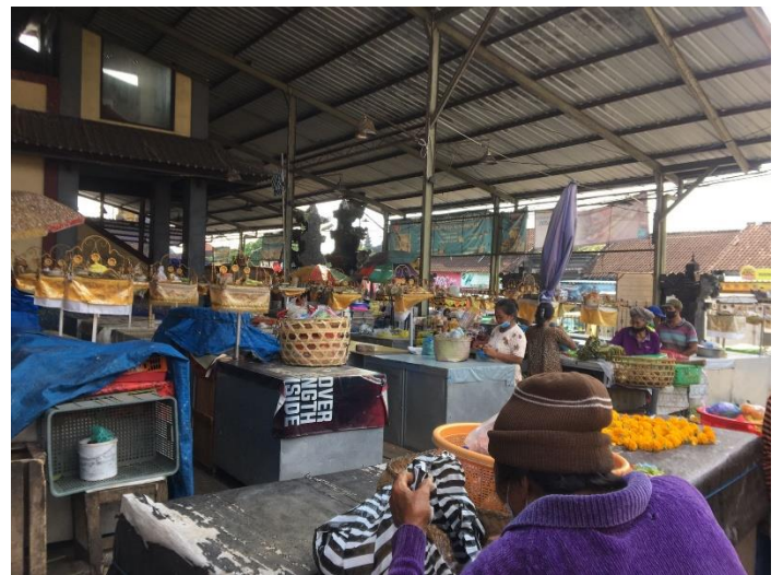
Keadaan Pasar Mambal